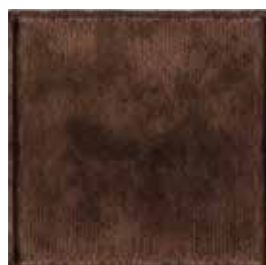
Cioccolato 1517 Chocolate 1517