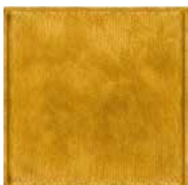
Senape 1513 Mustard 1513