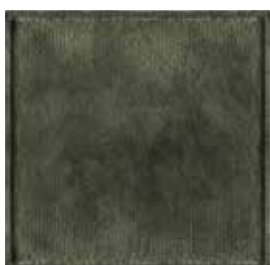
Verde Bosco Forest Green