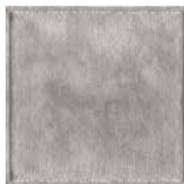
Titanio 1510 Titanium 1510