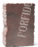
MASSOLO cod. G02100

tavolino coffee table table basse couchtisch mesa de centro